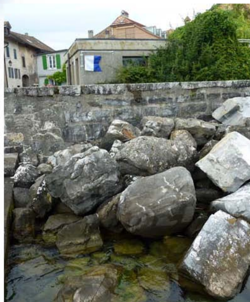
Vue depuis le lac