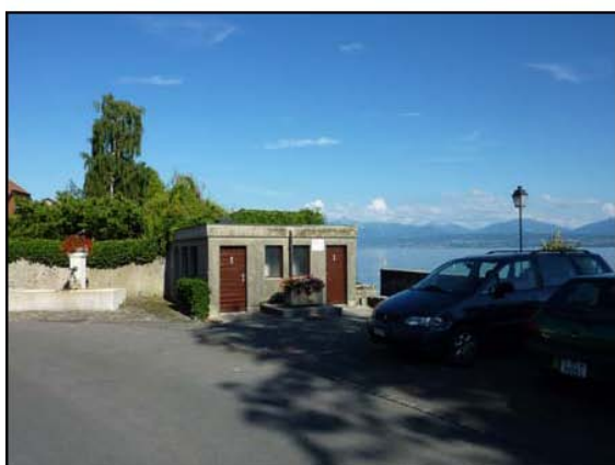
Vue depuis la place du Lac